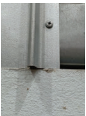
Fixed by screw on to purlin