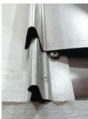
Install next panel on top of the screw to prevent the exposure directly to the weather